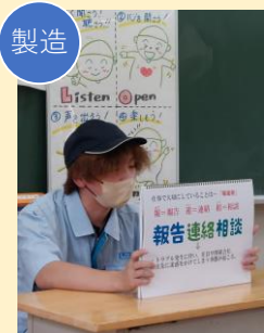
製造 株式会社金山コネクタ