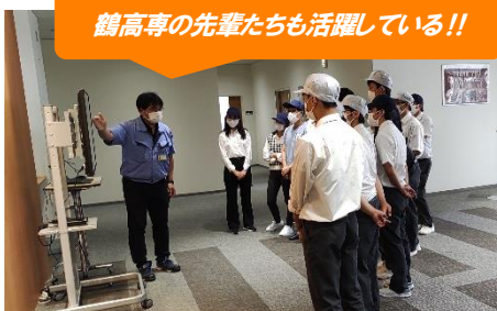
鶴高専の先輩たちも活躍している!!

今後も鶴岡工業高等専門学校と連携し、地元回帰に向けた取り組みを進めてまいります。